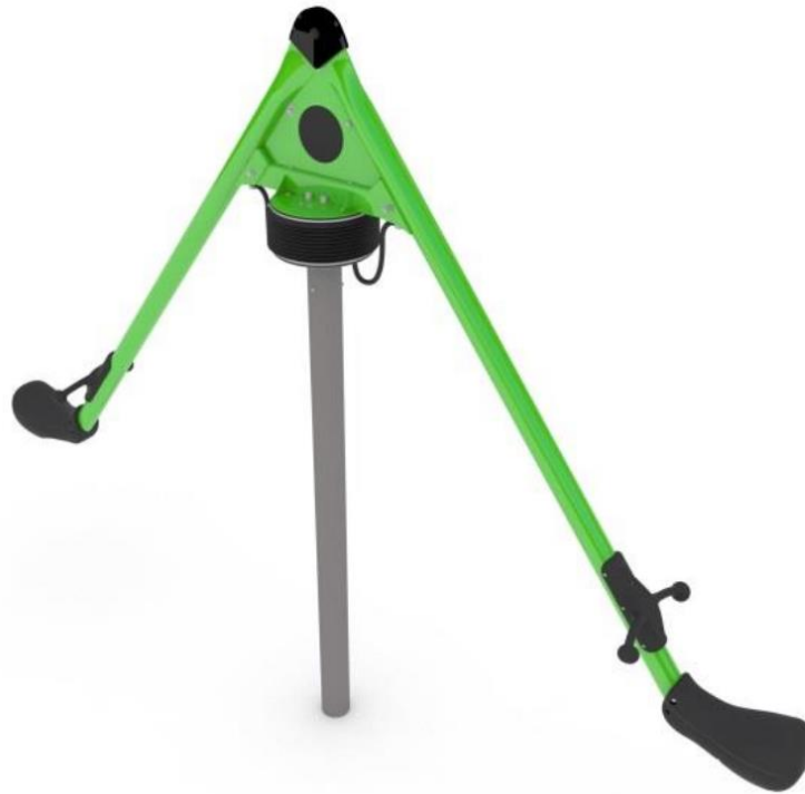
Rys. 3. Karuzela wahadłowa.