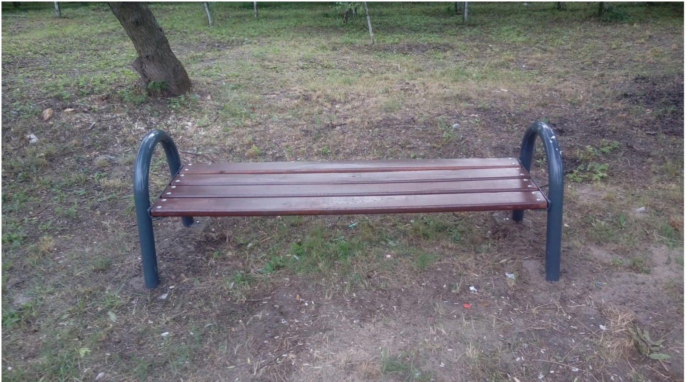
Rys. 6. Wygląd ławki