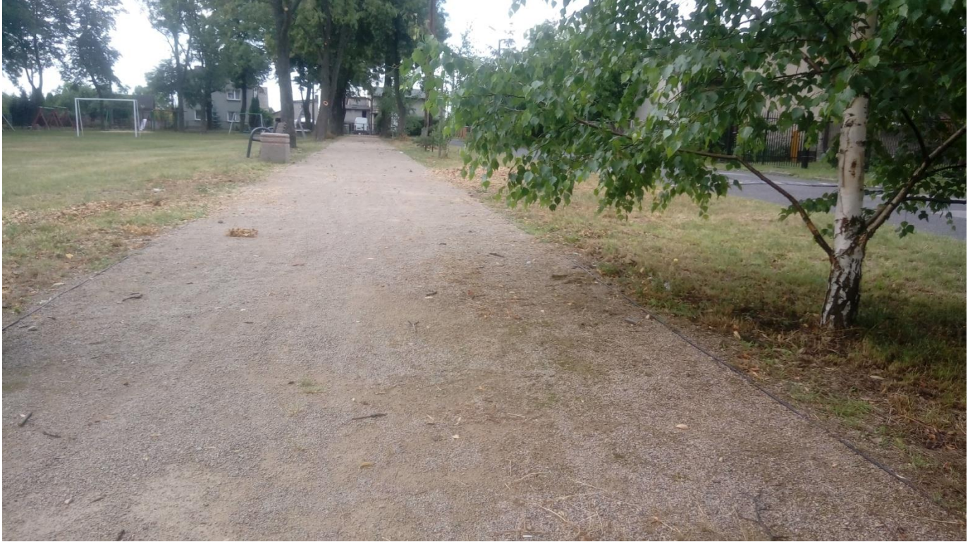
Rys. 5. Nawierzchnia bieżni.